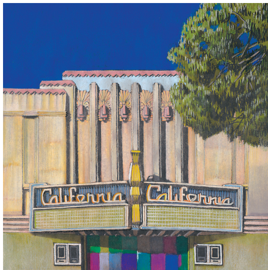
California, Berkeley - 2023 - Encres et pastels secs sur papier recyclé - Image 24 x 24 cm © Sarah Fouquet

Après des études en illustration à l'école des Arts Déco de Paris puis une résidence artistique à la Casa de Velázquez à Madrid, Sarah Fouquet s'installe en Normandie où elle vit, dessine pour la presse et l'édition et expose régulièrement son travail. Depuis 2018, elle mène une fructueuse collaboration avec les éditions Cahiers du Temps autour de ses dessins de paysage, consacrés au patrimoine industriel local, aux sites renaturés et aux jardins. Elle figure également dans les collections de prêt de l'artothèque de Bayeux, Le Radar, et dans le catalogue d'artistes de la plateforme VOAR.