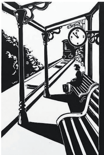
The Last Train - 2023 - N°3 sur 30 - Linogravure 40 x 50 cm