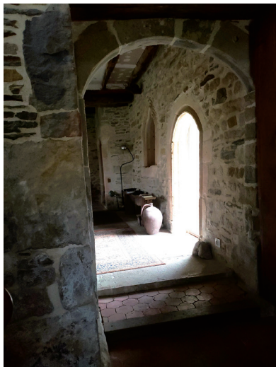
Wim Janssen ferme du Buquet Villy-Bocage

MANIFESTATION CULTURELLE PRÉ-BOCAGE INTERCOM-NORMANDIE ET RÉALITÉ ART ACTUEL