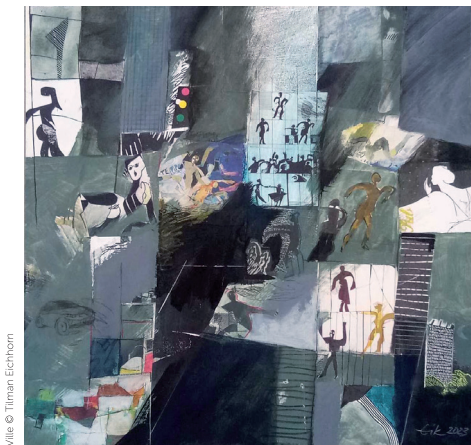
Ville © Tilman Eichhorn

Mais c'est la spécificité d'une technique - dessin, peinture, estampe - qui conduit par ses caractéristiques propres à la forme finale. Un arbre, un corps, un paysage renaissent comme un signe, un symbole, une transcription des impressions visuelles emmagasinées dans la mémoire, une image autonome et non pas une copie de quelque chose.