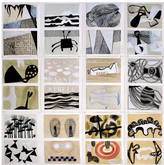
Journal d'été © Mireille Pontais-Riffaud - Dimensions variables

Les autres saisons ont donné d'autres formes de circonstance, plus graves, gravées.